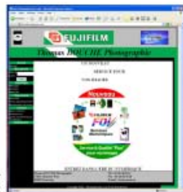
Intégration de Pix.Net dans votre site Internet

Pour obtenir des informations détaillées sur ce produit ou sur notre gamme de solutions pour l'automatisation des flux d'impression de fichiers numériques, visitez le site www.pokepix.com