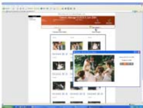
Interface personnalisée pour les photographes